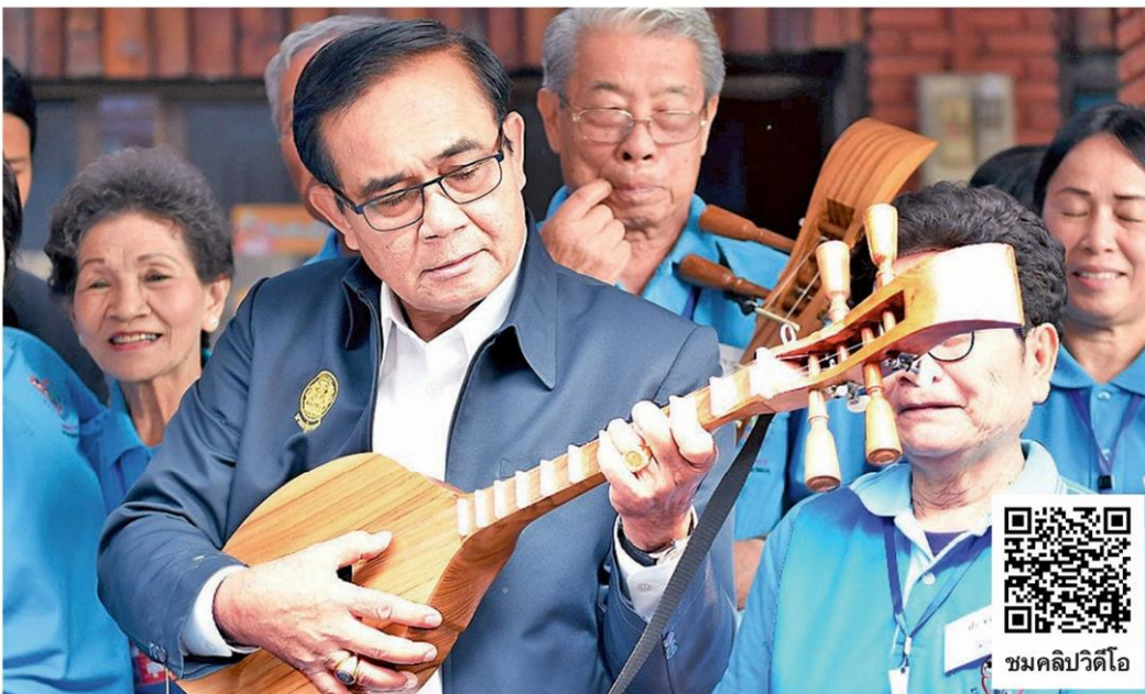
ขึ้นเหนือ - พล.อ.ประยุทธ์ จันทร์โอชา นายกรัฐมนตรีและหัวหน้า คสช. เวะทักษายและทดลองเล่นเครื่องดนตรี ระหว่างติดตามการดำเนินการดูแลผู้สูงอายุที่มหาวิทยาลัยวัยที่สามนครเชียงราย ในการเดินทางไปปฏิบัติราชการ พื้นที่ จ.เชียงราย เมื่อวันที่ 16 มีนาคม